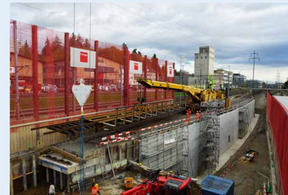
Arbeiten an der neuen Bahnunterführung – Einschub einer Hilfsbrücke

Bitte informieren Sie sich auf www.sbb.ch und www.bls.ch/verkehr .