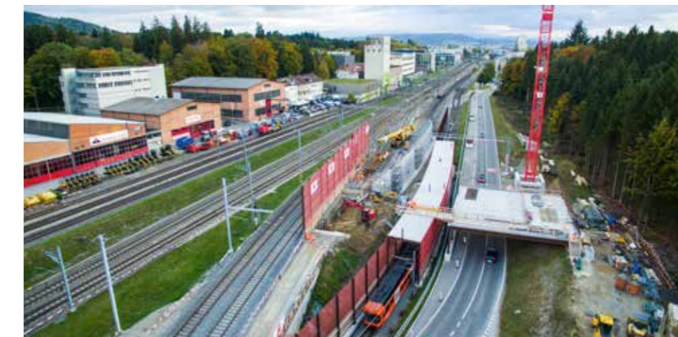
Bau der Stützmauer Nord und der neuen Bahnunterführung

Im Januar 2017 begannen die Hauptarbeiten an der RBS-Bahnstrecke – zwischen der Kantonsstrasse und den SBB-Gleisanlagen. Gebaut werden eine Doppelspur, eine neue Bahnunterführung und die dafür nötigen Stützmauern, um den nötigen Platz für die zweite Gleisanlage zu schaffen. Die 80 Meter lange Stützmauer Richtung Zollikofen wurde 2017 erstellt, 2018 starten die Arbeiten an der 550 Meter langen Stützmauer Richtung Moosseedorf. Diese werden Ende 2018 abgeschlossen sein. Die Arbeiten an der neuen Bahnunterführung im Tagbau sind bis 2019 im Gange. Die komplexen Bauarbeiten führen zu zeitweiligen Streckenunterbrüchen mit Bahnersatz. Die neue Doppelspur soll im Dezember 2019 in Betrieb genommen werden, die Bauarbeiten werden im Frühjahr 2020 beendet sein.