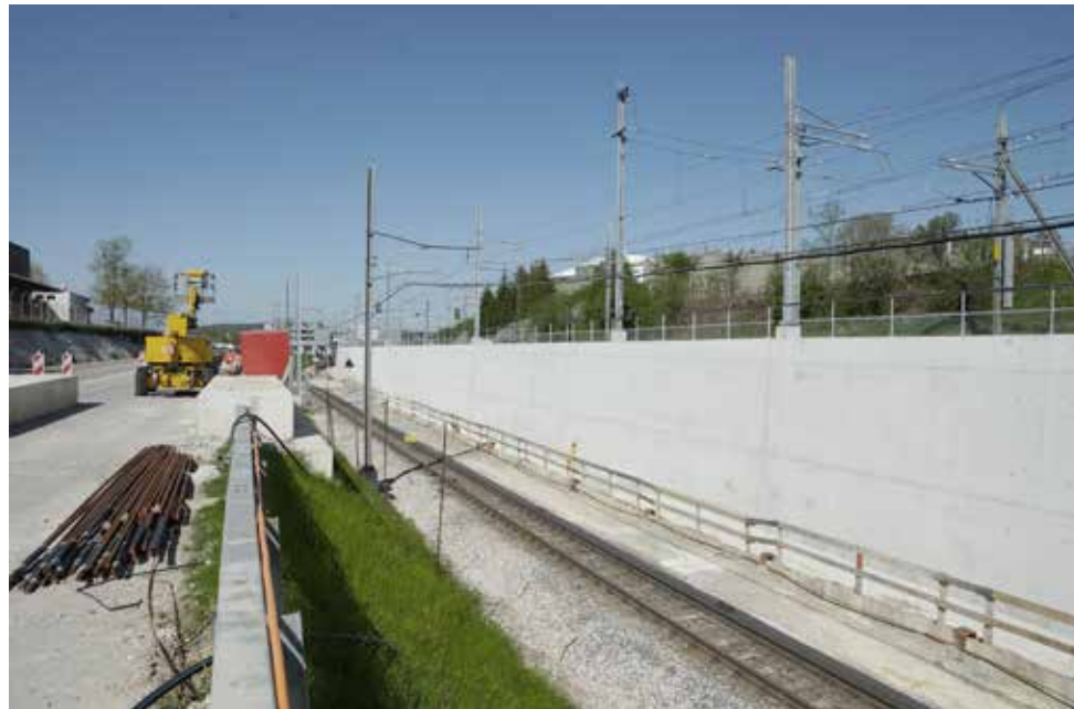
Die neue Stützmauer Nord

In den nächsten Monaten folgt der weitere Ausbau der nötigen Bahninfrastruktur. Das heisst u.a.: Abbruch des bestehenden und Erstellung des neuen Bahntrassees, Schotterarbeiten, Bahnschienen und kilometerlange Kabelstränge werden verlegt, die Fahrleitungsanlage und die dazugehörigen Fundamente errichtet. Zudem wird die ganze Bahntechnik eingebaut.